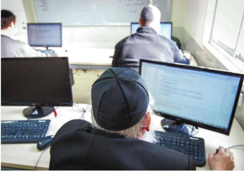
בית תוכנה בבני ברק. המנהלים דיווחו כי עובדים חרדים נרתמים פחות לעבודה בצוות, וממוקדים יותר בביצוע המשימה האישית שקיבלו על עצמם: צילום: אייל טואג

גם קרובי מודאג: "בעתיד החרדים צפויים להיות רוב, ועלינו לבצע פעולות שיעלו את איכות התעסוקה בחברה החרדית".