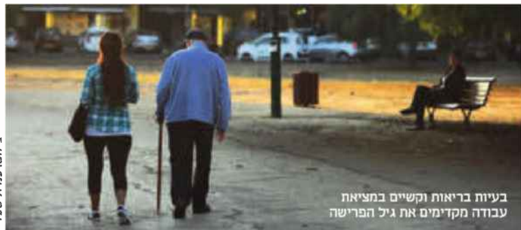
בעיות בריאות וקשיים במציאת עבודה מקדימים את גיל הפרישה