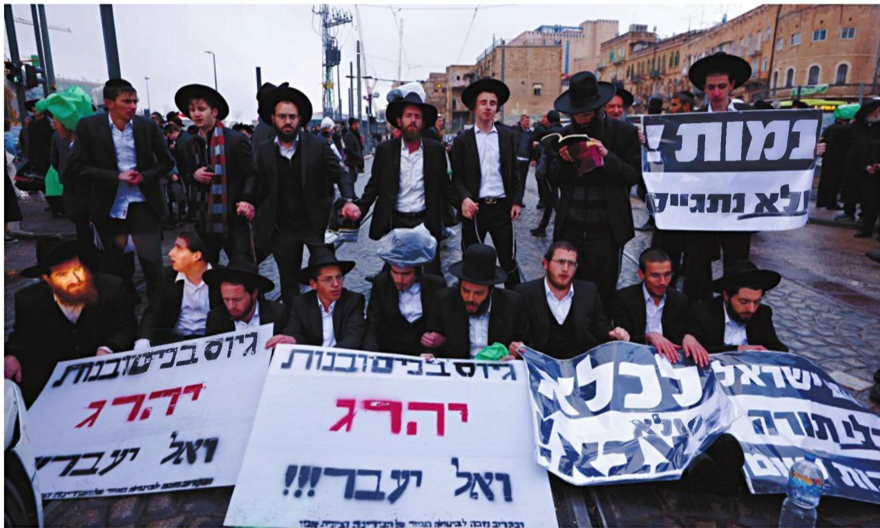
הפגנה נגד חוק הפטור, בשבוע שעבר. אפילו הסיורב להתגייס לא יעמוד כנראה בפני לחץ כלכלי מצד המדינה

זאת הצעה שנשמעת כמעט נאיבית: מה הסיכוי להכריח את החרדים להתגייס? הרבנים והפ"טריקים החרדים הרי אומרים "נמות ולא נתגייס" או "נעלה על מטוס לחו"ל ולא נתגייס". גם כמה מחוקרי החברה החרדית מעריכים כי תרבות חברת הלומדים נולדה בגלל הצבא. משמע – הגברים החרדים הולכים ללמוד ביישיבה לכל החיים לא מתוך אהבת הכולל, אלא מתוך שנאת הצבא.