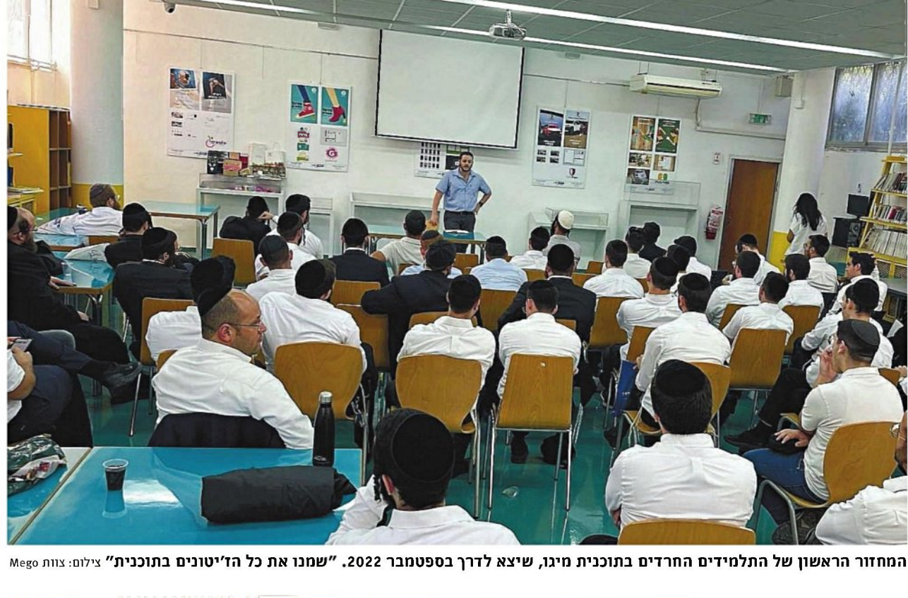
המחזור הראשון של התלמידים החרדים בתוכנית מיגו, שיצא לדרך בספטמבר 2022. "שמנו את כל הז'יטונים בתוכנית"

הקשורים לורוע העבודה בנתנת אינדיקציה מסוימת על מידת ההצלחה שלהם, ועל היקף ההשקעה: תוכנית מעלות עוסקת בהכשרת גברים חרדים לשיירות אורחית בתחום המחשוב, בעלות של 1.2 מיליון שקל. מבין 35 שסיימו את השירות האורחית, הרוב המכריע עובד בתחום, בשכר ממוצע של 17 אלף שקל. תוכנית קודקוד עוסקת בהכשרת גברים חרדים לקראת שירות ביחידות טכנולוגיות. מתוך 110 משתתפים, כ-90% עברו מיונים של צה"ל; 9 מיליון שקל תוקצבו לתוכנית הנועדה לצמצם את הנשירה של חרדים שולמדים תואר במקצועות המחשב; תוכנית נוספת, בעלות של 7 מיליון שקל, נועדה לממן שוברים להכשרה מקצועית במכללות פרטיות, למאות גברים ונשים. השוברים ניתנים לתלמידים בארבע אבני דרך, במקביל להתקדמות הלימודים. לפי הנתונים — רק 18% זכו לקבל את השובר הרביעי והאחרון, הניתן לאחר השמה במקום עבודה, מה שמעיד על שיעור הצלחה נמוך מאוד.